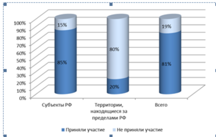
Рисунок 2 – Удельный вес регионов, принявших и не принявших участие в мониторинге в должествующем составе территорий, %