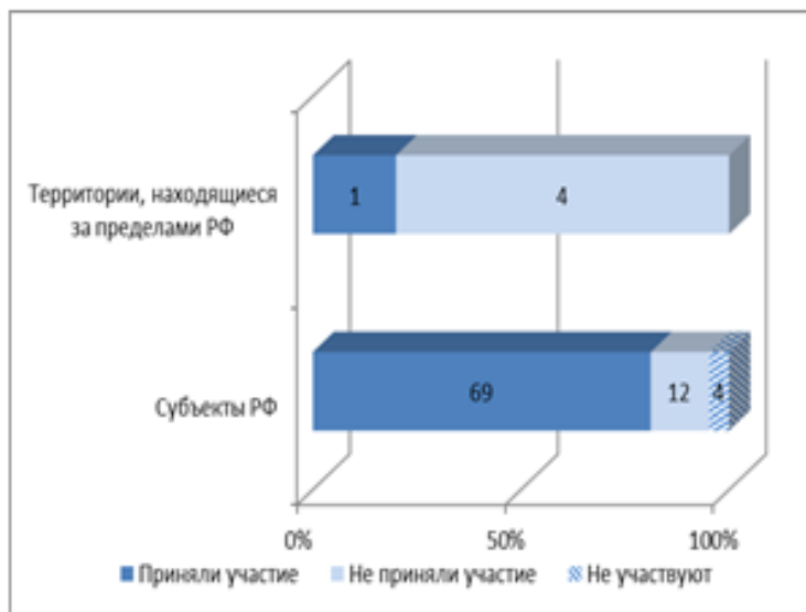
Рисунок 1 – Участие в мониторинге организаций, подведомственных Минобрнауки России, в региональном аспекте